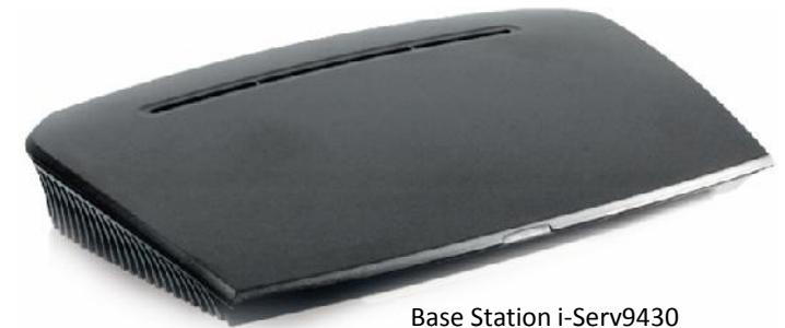
Base Station i-Serv9430